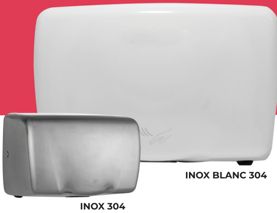
INOX BLANC 304