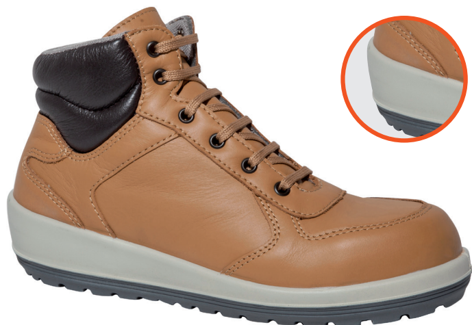
■ 1721 Miel