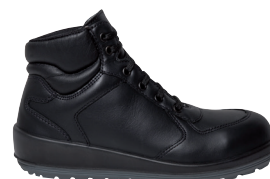
■ 1754 Noir

Spécialement conçues pour les femmes avec talon compensé 3 cm