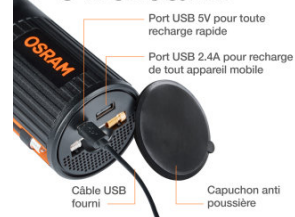
Product Info Graphics