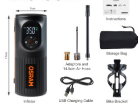
Product Info Graphics