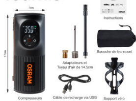
Product Info Graphics